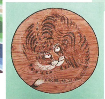
龍虎の絵 狩野 宗信 作